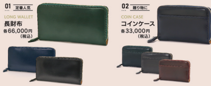
01 定番人気 LONG WALLET 長財布 ¥66,000円(税込)