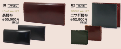
01 イタロ LONG WALLET 長財布 ¥55,000円(税込)