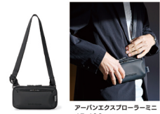
アバーン エクスプローラーミニ 15,400円(税込)