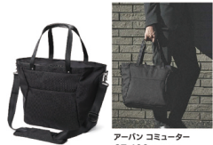
アバーン コミューター 37,400円(税込)

コンパクトなトラベルウォレット。高機能可能なショルダーバッグ、トラベルユースからデイリーなタウンユースまで、「これひとつあれば」を実現するフレキシビリティに富んだアイテム。