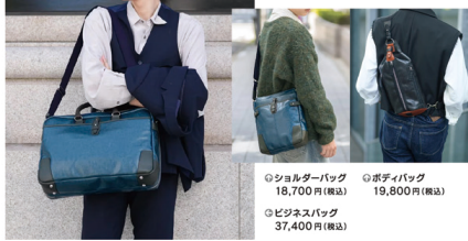
①ショルダーバッグ 18,700円(税込) ②ボディバッグ 19,800円(税込) ③ビジネスバッグ 37,400円(税込)

丈夫で軽やかな帆布生地にポリウレタンフィルムを圧着し、さらに濡み加工を施すことで、まるで本革のような風合いを持たせつつ、耐久性と扱いやすさを格段に高めています。加えて、ハンドル部やアクセント部分には本革を組み合わせることで、カジュアルな中にも上品で落ち着いた存在感を演出。毎日使うものだからこそ、耐久性や機能性、デザインのすべてにこだわりの、長くご愛用いただけるバッグシリーズに仕上がっています。