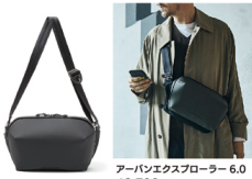
アバーン エクスプローラー 6.0 18,700円(税込)